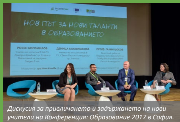
Дискусия за привличането и задържането на нови учители на Конференция: Образование 2017 в София.

2. Алтернативните програми са привлекли към училищните екипи хора с разнообразен академичен и професионален опит.