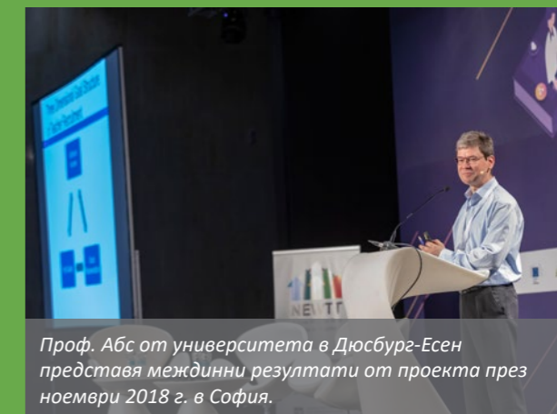
Проф. Абс от университета в Дюсбург-Есен представя междинни резултати от проекта през ноември 2018 г. в София.

Целта на NEWTT е опитът, придобит чрез тези пилотни програми, да послужи за изготвяне на препоръки за национални и европейски политики за привличане, обучение, развитие и задържане на нови специалисти в системата на училищното образование.